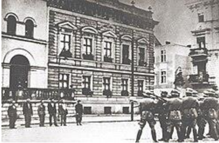
Ejecución pública por los nazis de rehenes polacos en la Plaza del Mercado Viejo de Bydgoszcz, 9 de septiembre de 1939.