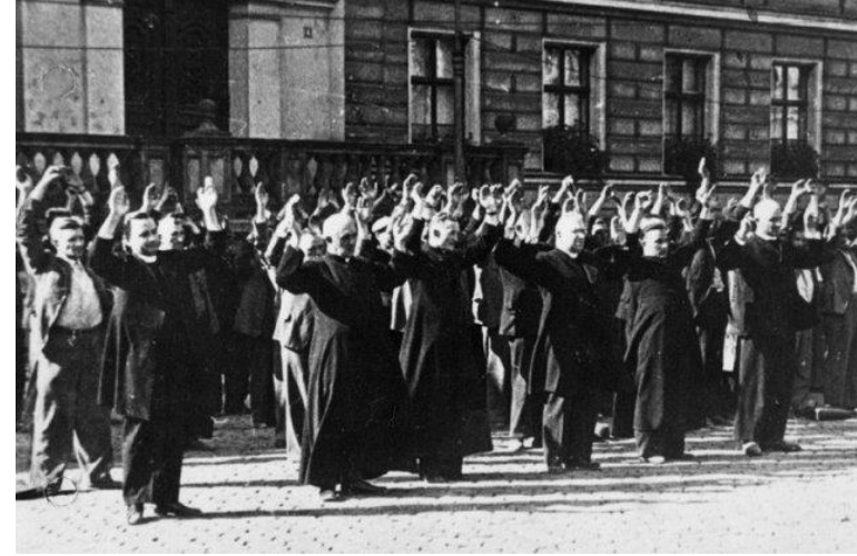
El momento de la muerte; la Plaza del Mercado Viejo de Bydgoszcz, 9 de septiembre de 1939.